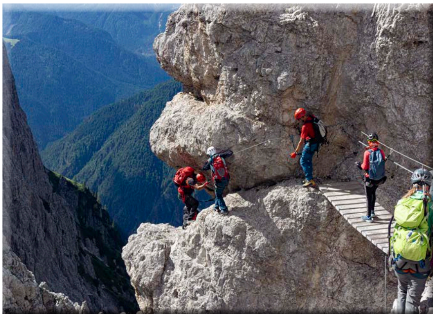
Dolomiti di Sesto