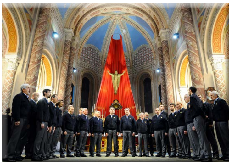
Chiesa di Castellamonte 2018