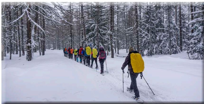
Rifugio Monte Bianco

Uscita sociale in Val Troncea, come da calendario, dove l'esercitazione comprenderà la ricerca con ARTVA e sonda e le tecniche di scavo con la pala.