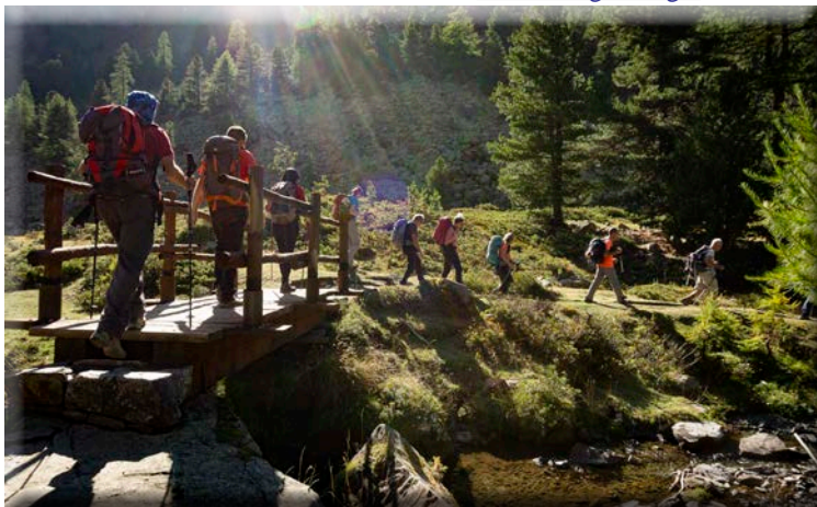
Escursione alla Becca di Nona

Per informazioni scrivere a: commgite@caiuget.it o iscriversi alla newsletter dal sito CAI UGET “Escursionismo – Commissione Gite” – www.caiuget.it/cge/