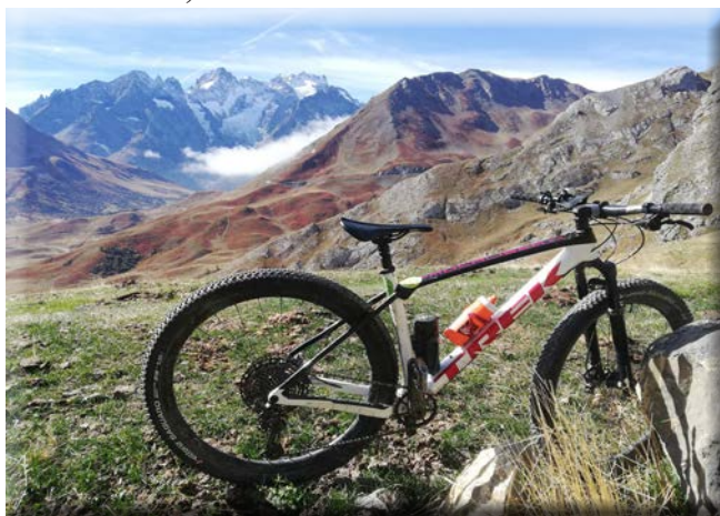
Colle del Lautaret e Meije