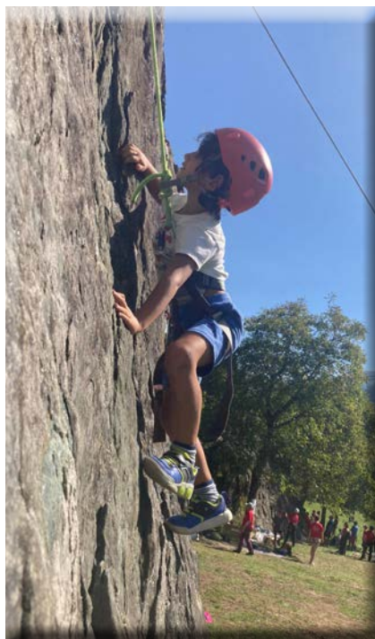
Massi di Cantoirra