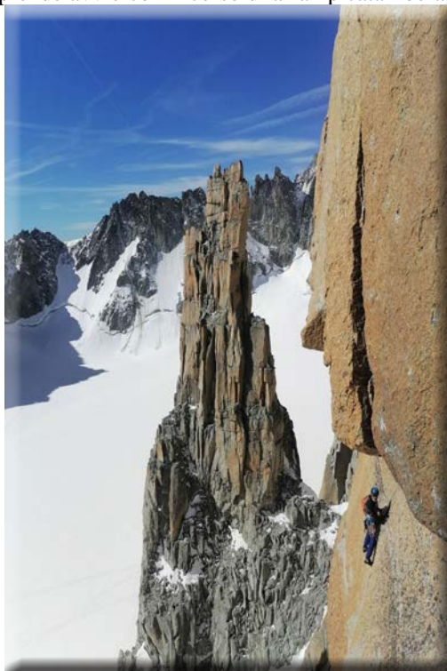
via Bonatti sul grand Capucin

Gli allievi che frequentano il percorso didattico con continuità, dimostrano buone capacità tecniche e attitudine all'insegnamento possono entrare a far parte dell'organico della scuola, dapprima come aspiranti istruttori e successivamente, se ritenuti idonei, come istruttori.