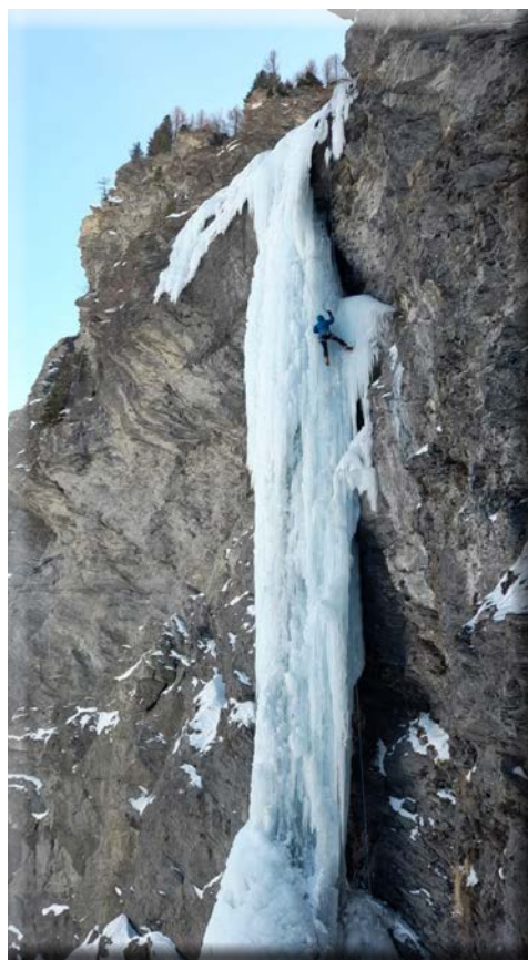
"L'altro volto del pianeta" valle Argentera