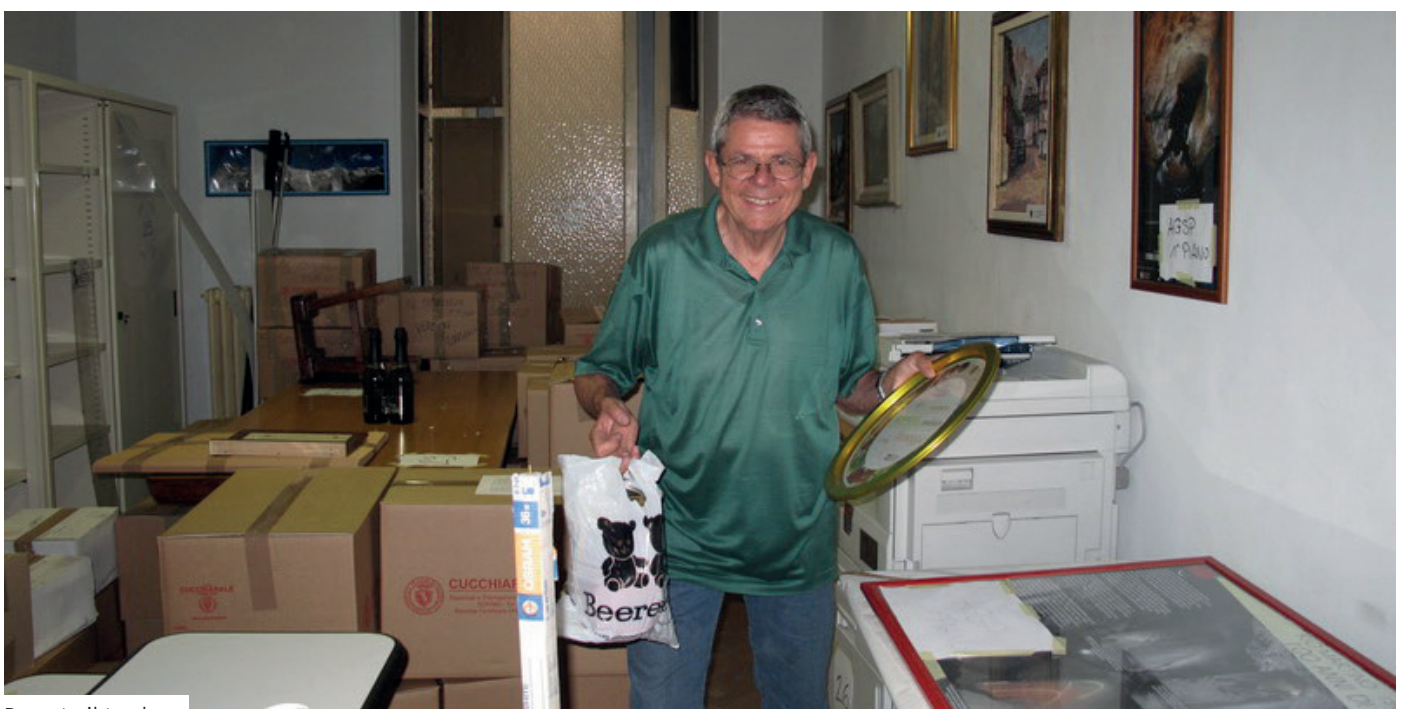
Durante il trasloco

In attesa di vederlo impegnato in qualche altra utilissima attività in UGET, un super ringraziamento da parte del Direttivo tutto e di tutti i Soci che hanno potuto beneficiare della sua operosa attività!