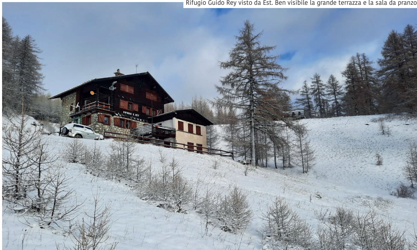
Rifugio Guido Rey visto da Est. Ben visibile la grande terrazza e la sala da pranzo.