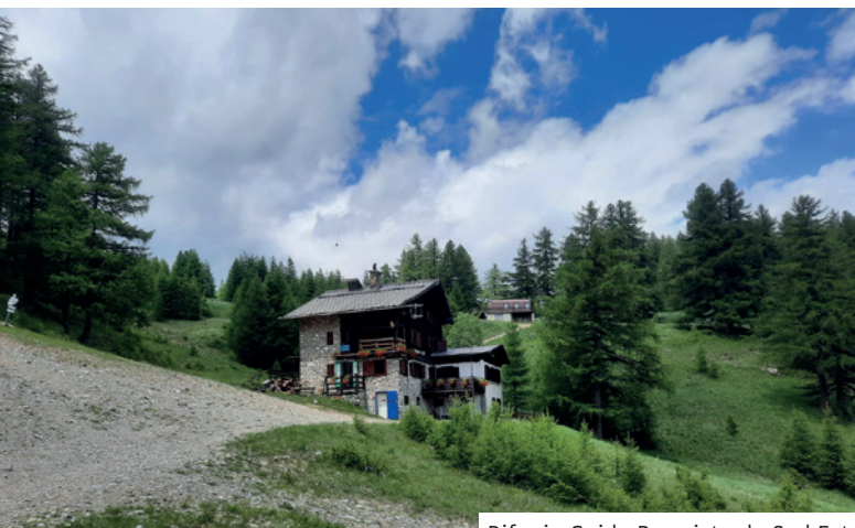
Rifugio Guido Rey visto da Sud Est.

In questo momento però, nell'imminenza dell'apertura stagionale, con molte problematiche di ordine pratico da risolvere, non abbiamo ancora avuto la possibilità di impostare una vera e propria "campagna pubblicitaria" né di dar luogo a progetti a lungo termine sulla gestione di attività collegate al rifugio come campi estivi per i ragazzi o soggiorni a tema. Abbiamo però individuato alcune peculiarità che possono far valutare positivamente la nostra struttura: si trova in prossimità di uno splendido bosco di conifere, ricco di fauna; è uno dei pochi rifugi raggiungibile comodamente in treno da Torino e questo lo rende particolarmente fruibile a chi, per scelta o per necessità, decide di non utilizzare l'auto, mezzo di trasporto sempre più dispendioso.