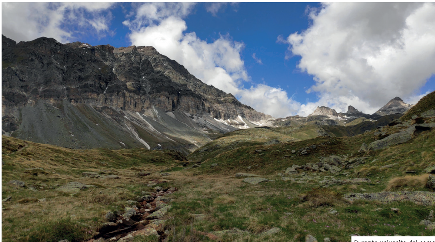
Durante un'uscita del corso.

Ho avuto la fortuna di conoscere il CAI UGET - e Torino - proprio nell'anno di ritorno alle attività in presenza dopo il lungo periodo di pausa dettato dalla pandemia. Tra tutte le attività presentate per il 2022, ciò che mi ha spinto a valicare le scale della Segreteria è stato il Corso Base di Escursionismo - quale miglior scusa per approfondire la conoscenza con il territorio locale, un'istituzione importante come il CAI, questa città e la gente che la abita?