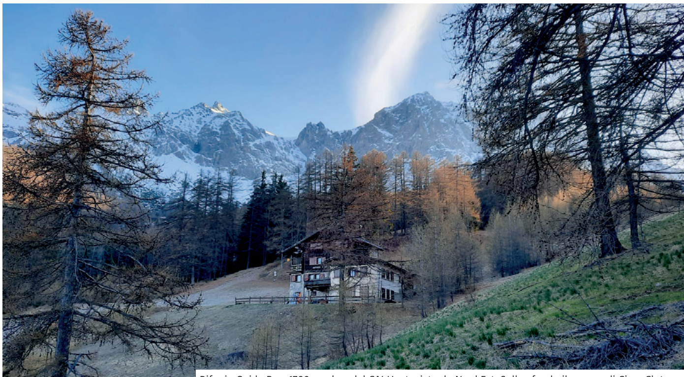
Rifugio Guido Rey, 1780 m s.l.m. del Cai Uget, visto da Nord Est. Sullo sfondo il gruppo di Cima Clotesse.

Testo di Giovanna Bonfante.